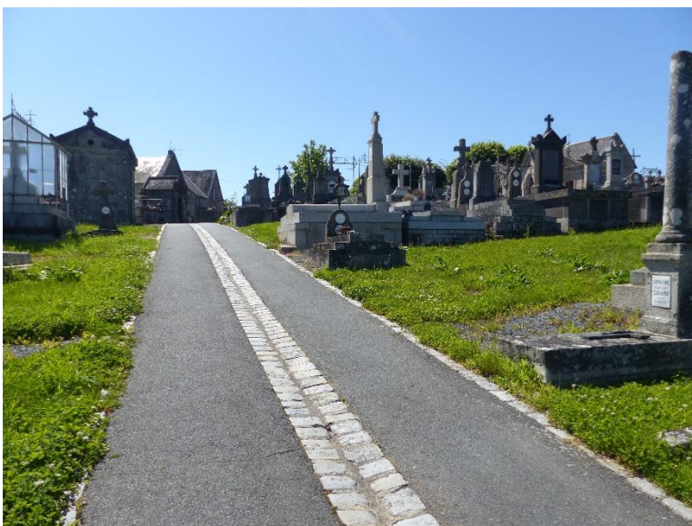
Maintien d'une zone de roulage imperméabilisé et enherbement des inter-tombes – Guéret

Voici quelques exemples de pratiques de gestions mises en place par des communes creusoises.