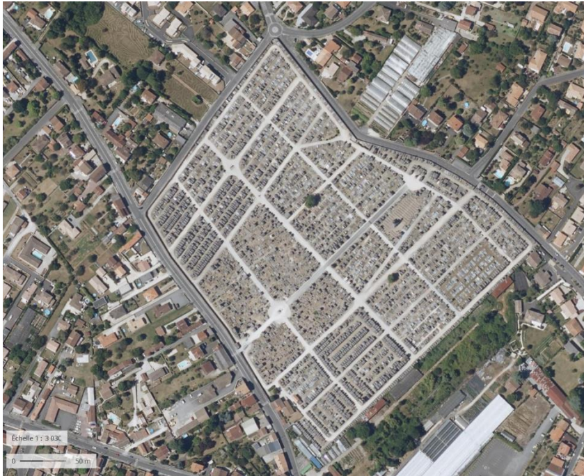
Cimetière vu du ciel