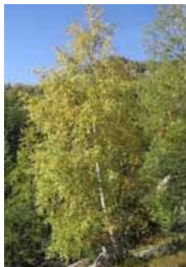
Bouleau - Betula pendula Milieu de sénescence