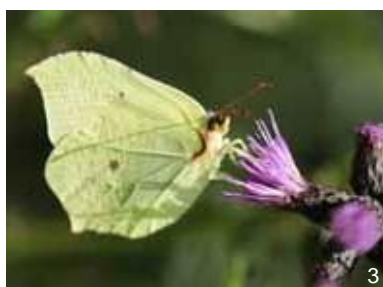
Papillon citron - Gonepteryx rhamni