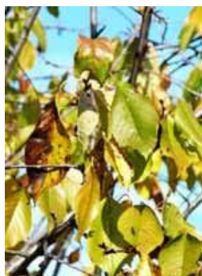
Cerisier - Prunus avium Milieu de sénescence

Effectuez au moins un passage par semaine devant vos plantes. Pensez à vous doter des fiches d'identification des espèces animales et végétale disponibles sur le site Internet du CPIE.