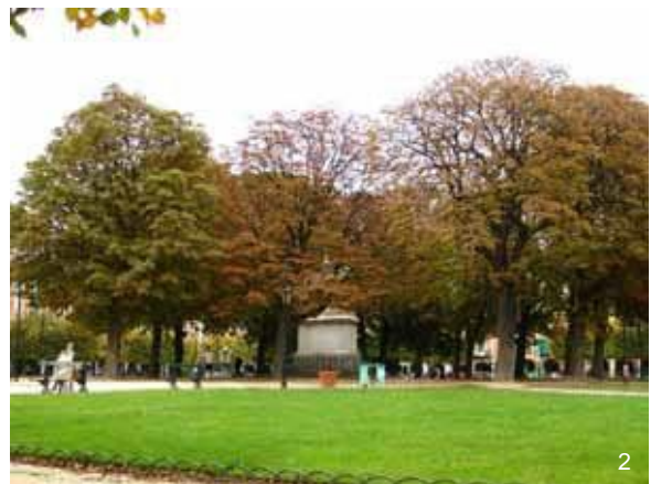
Square de ville