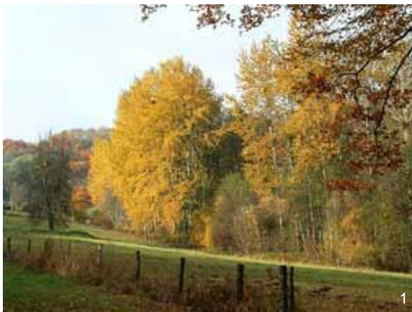
Bordure de champs

Pour chaque station, relevez le type de milieu de la zone : forêt, champs, ville, jardin.