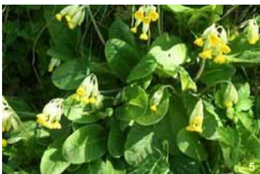
Primevère - Primula veris

Les observations sont très simples à réaliser, c'est pourquoi il n'y a pas de planche des événements phénologiques pour ces espèces. Pour les plantes herbacées, vous devez observer la floraison et noter la date à laquelle la première fleur épanouie a été vue au sein de votre station. Pour les animaux (oiseaux et insectes), il faut noter la date à laquelle l'animal a été vu pour la première fois sur votre station.