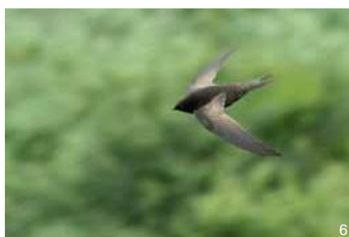
Martinet - Apus apus

Sur le terrain, pensez à vous doter des fiches d'identification des espèces animales et végétales disponibles sur le site Internet du CPIE : www.cpiepayscreusois.com