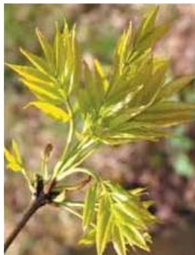
Frêne - Fraxinus excelsior début de feuillaison