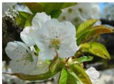
Cerisier - Prunus avium

C'est un peu différent que pour les plantes. Choisissez une zone d'étude d'environ 3 km de diamètre dans laquelle vous avez déjà observé l'espèce. Vous n'aurez plus qu'à noter la date d'apparition (retour de migration, éclosion...) du premier individu de l'espèce choisie.