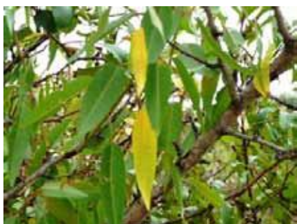
Amandier - Prunus dulcis Début de sénescence

Attention ! « Changé de couleurs » veut dire que la feuille a perdu son vert d'origine mais elle n'est pas forcément déjà bien jaune ou bien rouge :