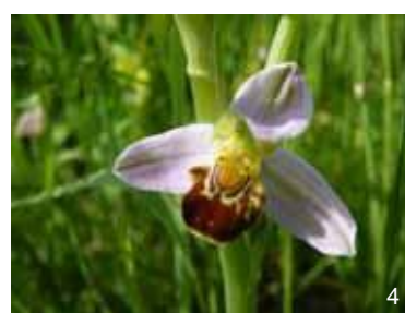
Ophrys abeille - Ophrys apifera

Il vous faut maintenant apprendre à reconnaître les événements que vous allez observer.