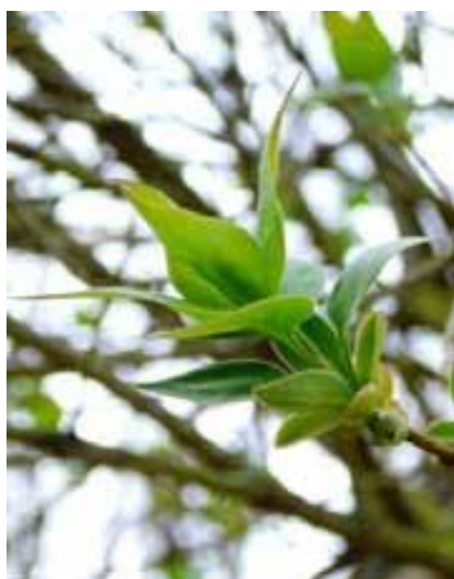
Lilas - Syringa vulgaris début de feuillaison

• Milieu de feuillaison : Notez la date à laquelle 50% des feuilles sont épanouies